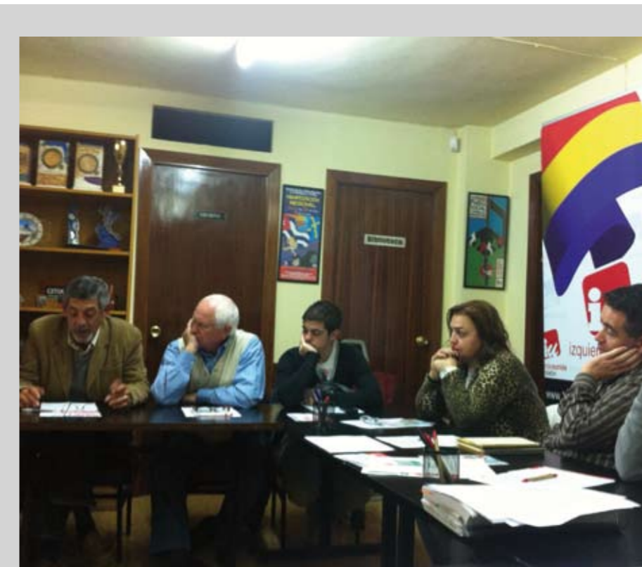
Reunión del Consejo Político de IU-Xixón