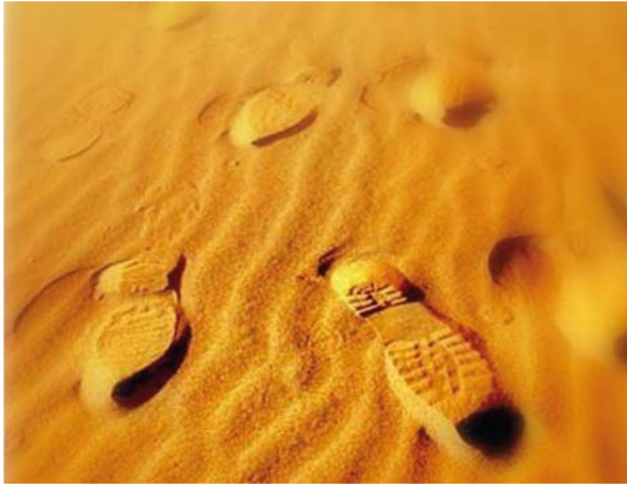
Imagen de cartel de las Jornadas de Movilidad año 2007, organizadas por la FAV