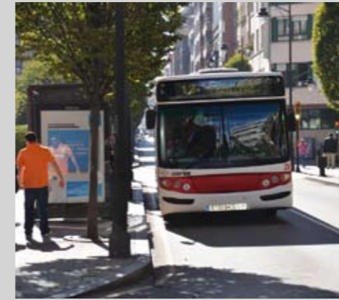
Carri bus na Avenida Schultz