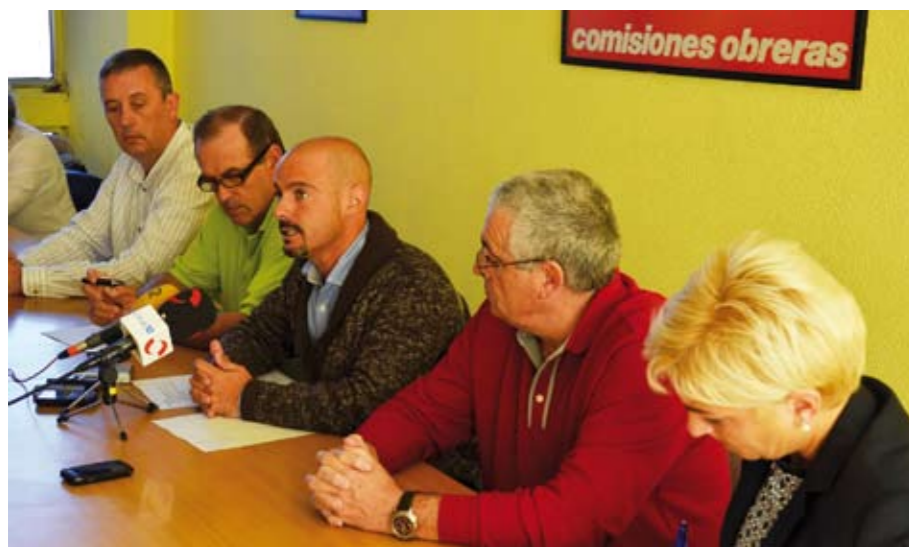
Reunión del grupu municipal de IU-LV con la executiva comarcal de CC.OO.

Nel marcu del alderique al rodiu del Plan de Movilidad, fízose una ronda de contaos colos colectivos más afeutaos, entamando poles seiciones sindicales de CC.OO. n'Emtusa y la Empresa Mesta de Tráficu (emplegaos de la ORA).